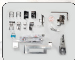
PROFITEZ DE LA GRANDE VARIÉTÉ DES 16 PIEDS PRESSEURS