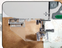
GET A CLOSE-UP VIEW WITH THE OPTIONAL OPTIC MAGNIFIER