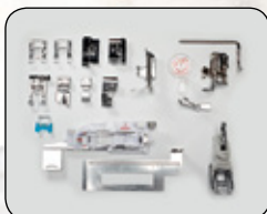
ENJOY A WIDE ARRAY OF 16 PRESSER FEET