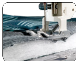
SYSTÈME D'ALIMENTATION DU TISSU ACUFEED FLEX TM: PIQUE AUSSI ÉPAIS QUE VOUS LE VOULEZ