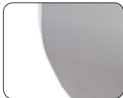
ONE-STEP NEEDLE PLATE CONVERSION