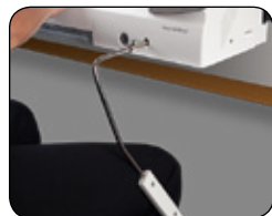
RAISE YOUR NEEDLE WITHOUT USING YOUR HANDS