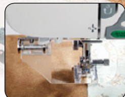
VOYEZ LES CHOSSES DE PLUS PRÈS AVEC LA LOUPE OPTIONNELLE